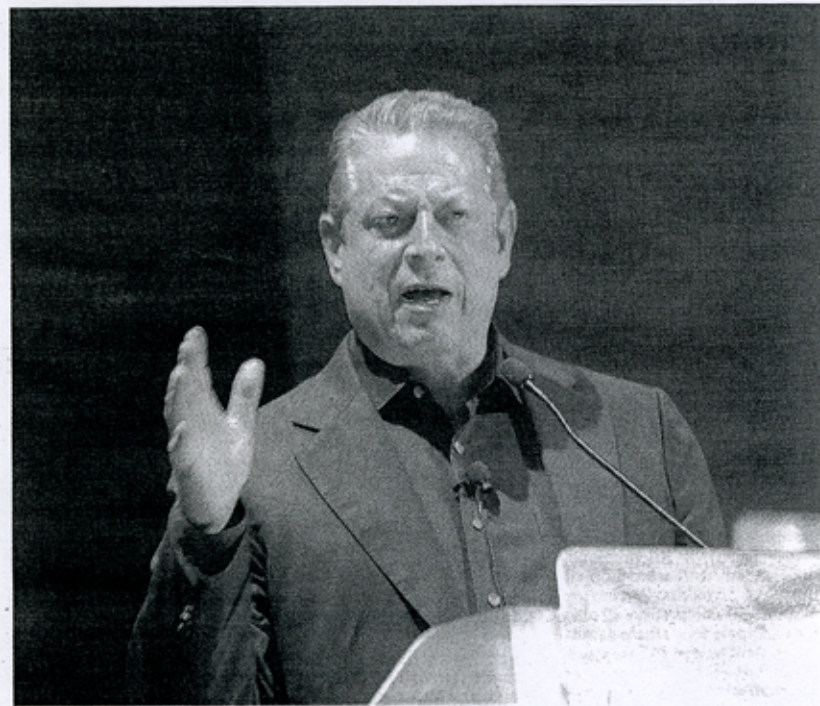
OPINIONI FORTI Al Gore e, a destra, Roberto Saviano durante i loro interventi al Morlacchi

IDUE sono stati accolti al Teatro Morlacchi da autentiche ovazioni, con tutto il pubblico in piedi ad applaudirli. Dopo l'intervento di Saviano, il quale ha evidenziato come «gli arresti di tanti esponenti della criminalità organizzata siano importanti, ma per combatterla veramente occorre soprattutto un 'movimento culturale' sostenuto dall'intero paese», Al Gore — fondatore del network Current Tv — ha illustrato le grandi trasformazioni in atto nel mondo dei media, soffermandosi in parti-